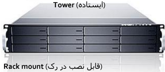
Rack mount (قابل نصب در رک)